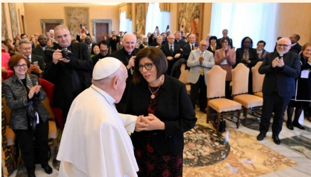
Miembros del Movimiento de los Focolares recibidos en audiencia por el Papa Francisco

El pasado 7 de diciembre, el Santo Padre recibió en Audiencia a los miembros del Movimiento de los Focolares, con motivo del 80º aniversario de su fundación. Publicamos un fragmento del discurso que el Papa les dirigió durante la Audiencia: